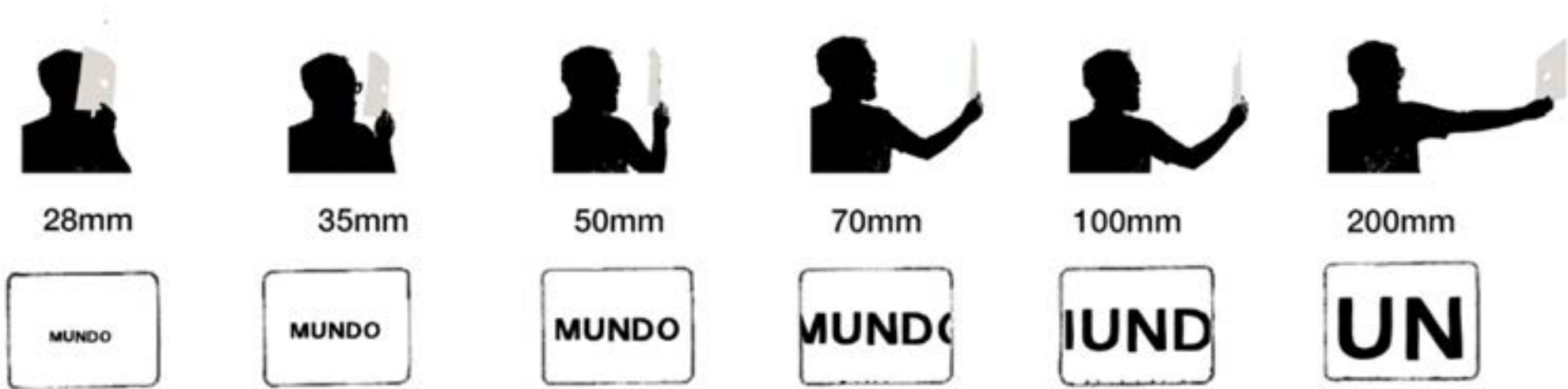
Ilustración: Rafael Frazão