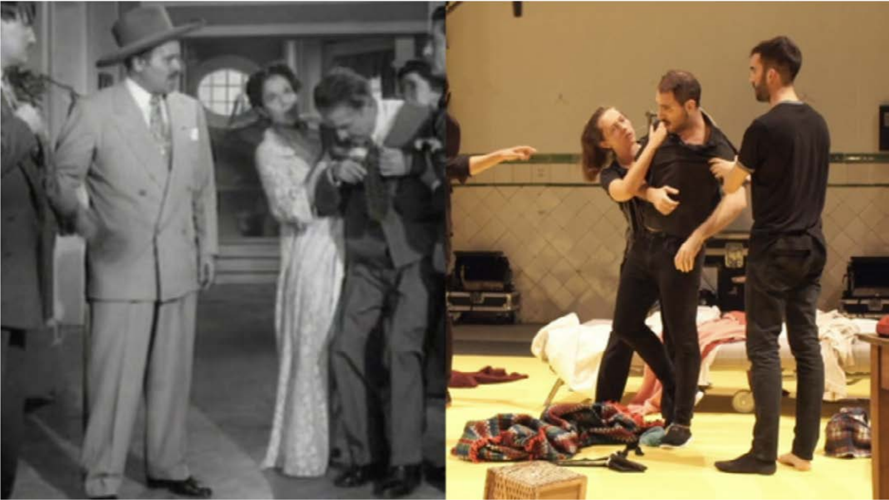
Frame del vídeo de la pieza